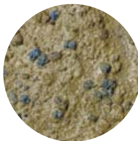
Trockenpressung nach 110 mm Regen